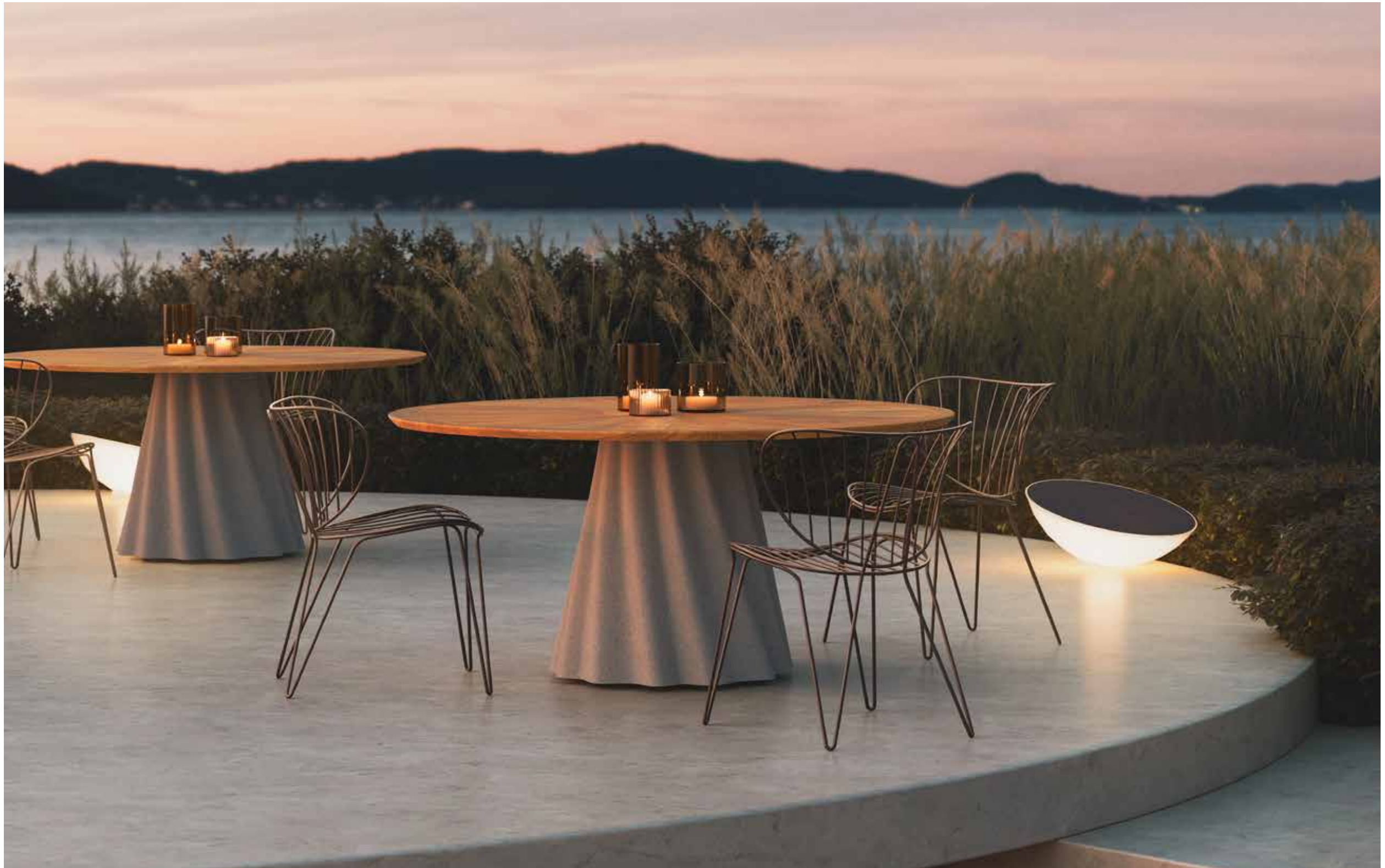
Onda tavolo outdoor. Piano legno Iroko, base 61 Cemento. / Onda outdoor table. Top in Iroko wood, base in finish 61 Cemento.