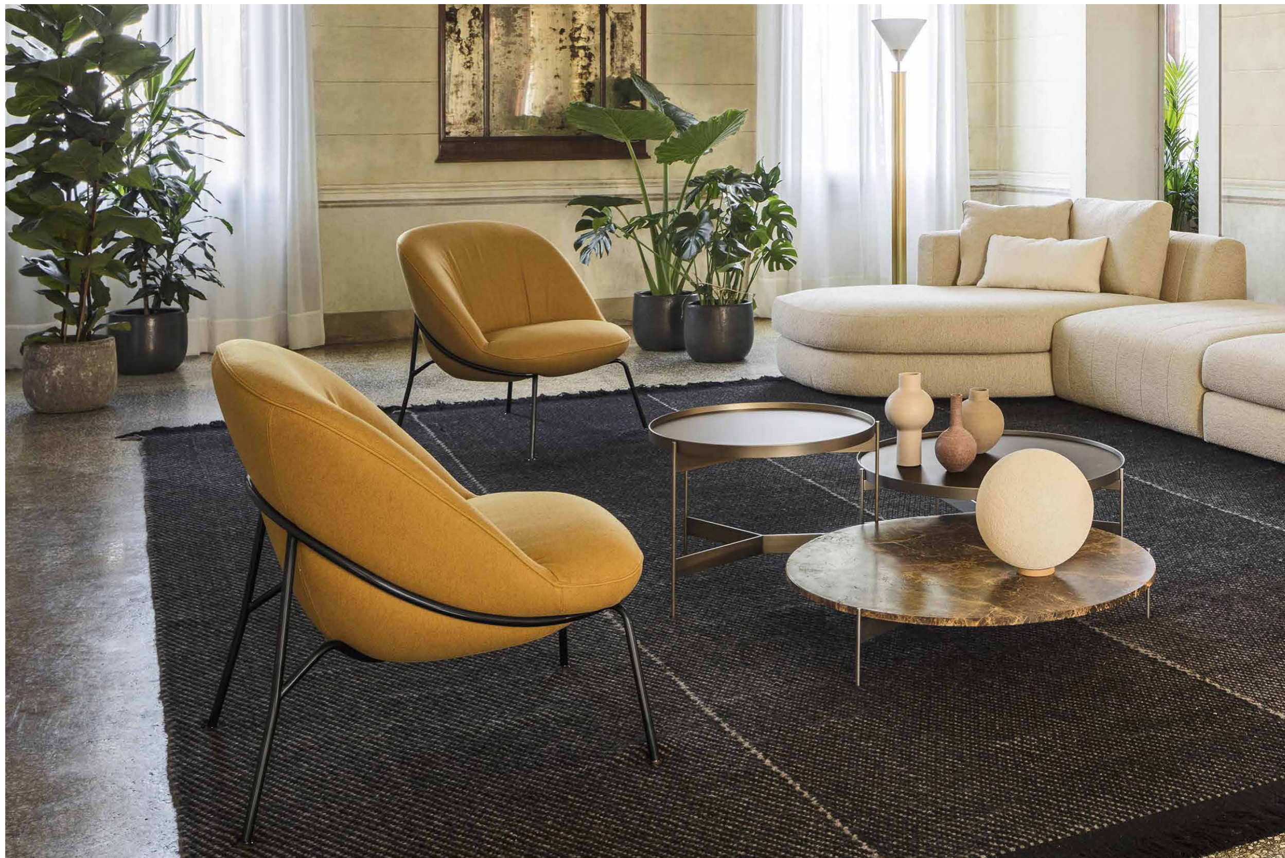
Ella poltrona in tessuto Erica 82 con profilo Gros Grain col. 63. Basamento laccato Nero. / Ella armchair in Erica 82 fabric with Gros Grain edging col 63. Nero lacquered base.